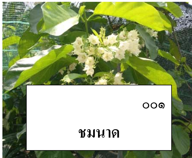
ป้ายชื่อพรรณไม้ชั่วคราว มีหมายเลขรหัส และชื่อพื้นเมือง