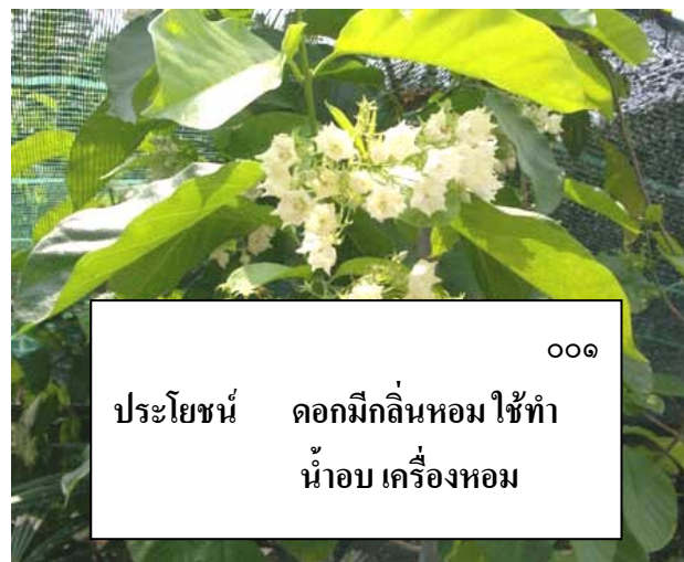
ป้ายชื่อพรรณไม้ชั่วคราว มีหมายเลขรหัส ชื่อพื้นเมือง และประโยชน์