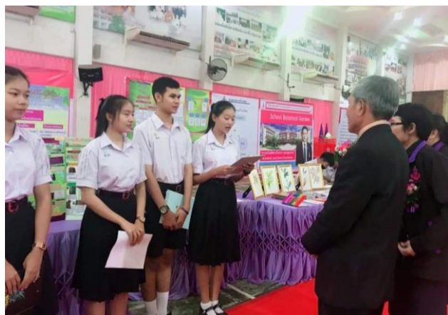
ภาพที่ 5 - 6 ที่ปรึกษาศูนย์ประสานงานฯ และเจ้าหน้าที่โครงการอนุรักษ์พันธุกรรมพืชฯ เยี่ยมชมนิทรรศการ