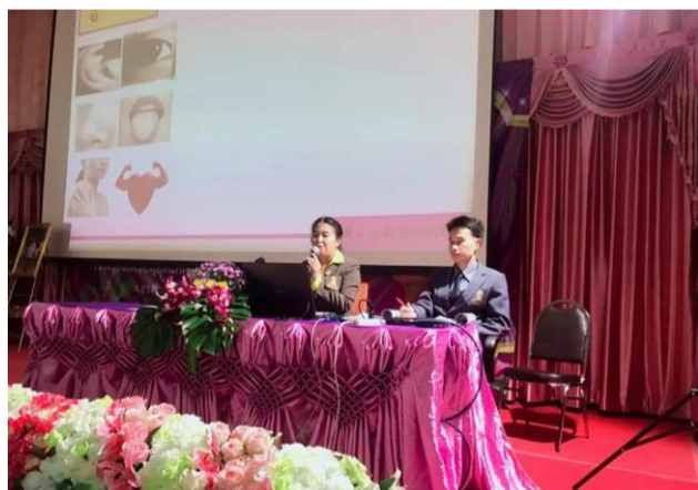
ภาพที่ 4 คณะคุณครู นำเสนอผลการดำเนินงาน ด้านที่ 2 การดำเนินงาน และด้านที่ 3 ผลการดำเนินงาน