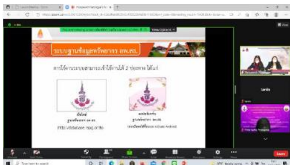
ภาพที่ 6 วิทยากรศูนย์แม่ข่ายฯ บรรยายการบันทึกข้อมูลใน application