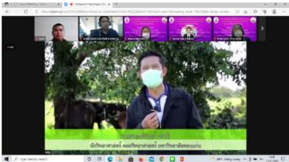
ภาพที่ 3 สาธิตการบันทึกใบบางที่ 5