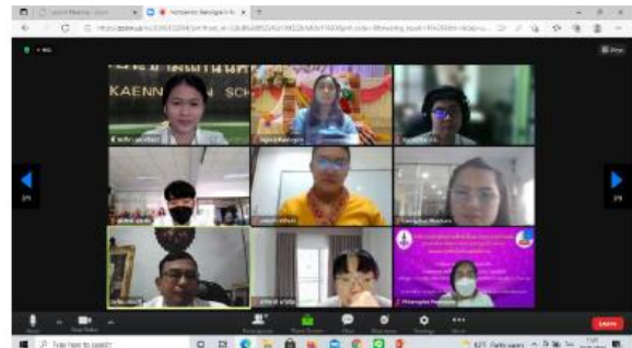
ภาพที่ 4 บรรยากาศในห้องประชุม