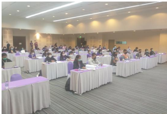
ภาพที่ 3 ภาพบรรยากาศ ในห้องฝึกอบรมฯ