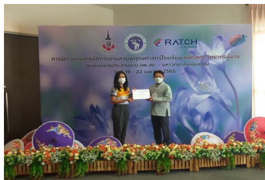
ภาพที่ 6 วิทยากรผู้ช่วย รับเกียรติบัตร รับรอง การผ่านการฝึกอบรม หลักสูตรวิทยากรผู้ช่วย