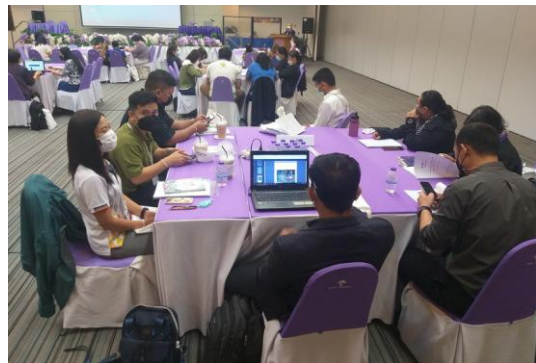
ภาพที่ 4 ปฏิบัติการกลุ่มอธิบายตัวชี้วัดเกณฑ์การประเมิน