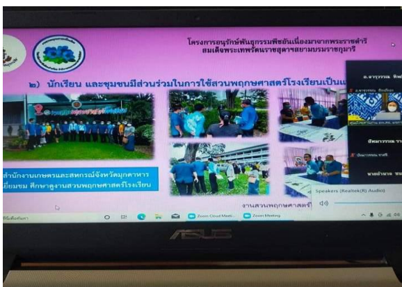
ภาพที่ 3 นำเสนอด้านที่ 2 การดำเนินงาน และด้านที่ 3 ผลการดำเนินงาน ครู-อาจารย์โรงเรียนราชประชานุเคราะห์ 52 จังหวัดเลย