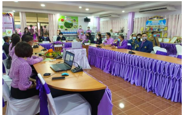
ภาพที่ 2 ผู้บริหารและครู นำเสนอ การดำเนินงานฯ ด้านที่ 1-3 สามสาระ การสำรวจจัดทำฐานทรัพยากรท้องถิ่น