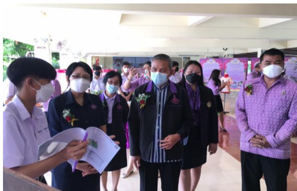
ภาพที่ 3 คณะกรรมการเยี่ยมชมนิทรรศการฯ