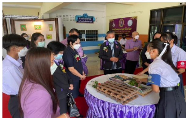
ภาพที่ 4 คณะกรรมการเยี่ยมชมนิทรรศการฯ