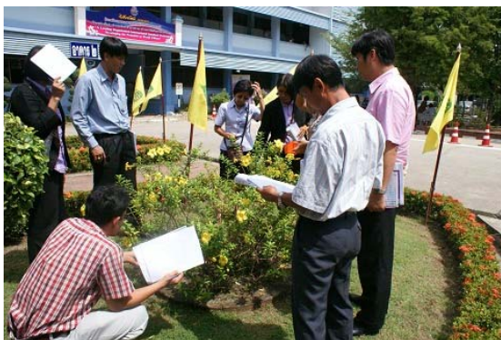
บรรยายภาคการฝึกปฏิบัติการนอกพื้นที่