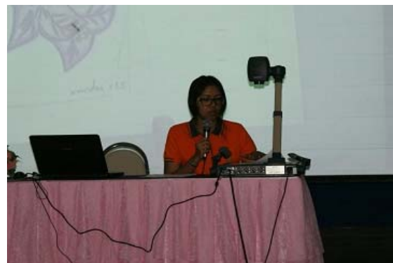
คุณครูนำเสนอผลงานจากการเรียนรู้องค์ประกอบที่ ๓ และองค์ประกอบที่ ๔