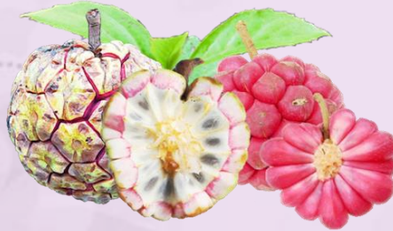
น้อยหน้าเครือ