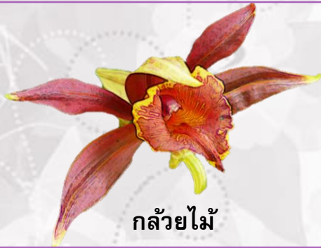
กลัวยไม้