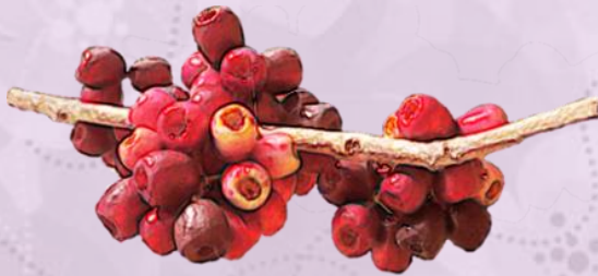
มะเกี๋ยง