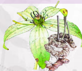
ตีนชิ่งดอย