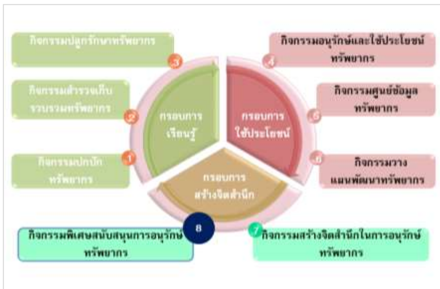
แผนภาพ แสดงการดำเนินงาน 3 กรอบ 8 กิจกรรมของโครงการอนุรักษ์พันธุกรรมพืชฯ

โครงการอนุรักษ์พันธุกรรมพืชอันเนื่องมาจากพระราชดำริฯ ได้มีนโยบายให้ องค์การบริหารส่วนจังหวัด (อบจ.) สามารถดำเนินการเข้าร่วมสนองพระราชดำริ ในกรอบการสร้างจิตสำนึก กิจกรรมที่ 8 กิจกรรมพิเศษสนับสนุนการอนุรักษ์ทรัพยากร โดยสมัครเป็นสมาชิก “ฐานทรัพยากรท้องถิ่น”