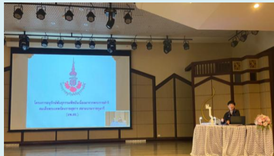
ภาพที่ 2 การบรรยายพิเศษ โดย ผู้บริหาร อพ.สธ.