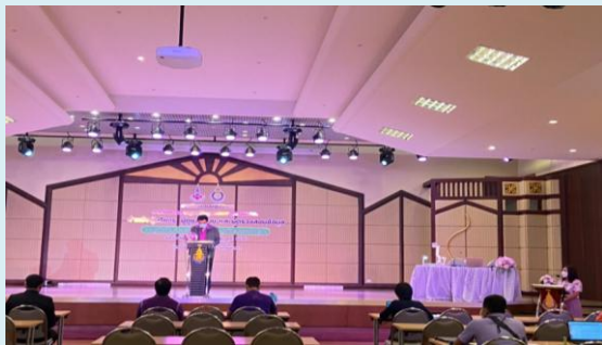
ภาพที่ 1 พิธีเปิดการฝึกอบรมปฏิบัติการฯ

สมาชิกฐานทรัพยากรท้องถิ่นเข้าร่วมฝึกอบรมฯ ผ่านสื่ออิเล็กทรอนิกส์ออนไลน์ โปรแกรม Zoom meeting ในการบันทึกข้อมูลลงระบบฐานข้อมูลทรัพยากร อพ.สธ. จำนวน 14 แห่ง