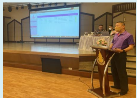
ภาพที่ 3 - 5 การบรรยายและนำปฏิบัติการโดย คณะวิทยากรจากบริษัทอินเทอร์เน็ตประเทศไทย จำกัด และเจ้าหน้าที่อพ.สธ.