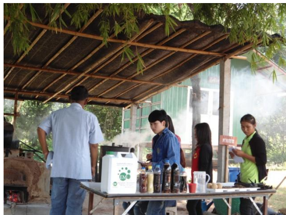
ชมสาธิตการผลิตน้ำส้มควั่นไม้ และเรียนรู้เกี่ยวกับการทำปุ๋ยหมักชีวภาพทั้งแบบแห้งและน้ำ