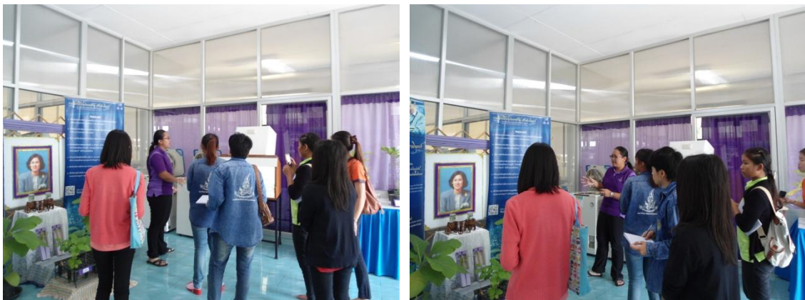
เรียนรู้เทคนิคการขยายพันธุ์พืชด้วยการเพาะเลี้ยงเนื้อเยื่อ