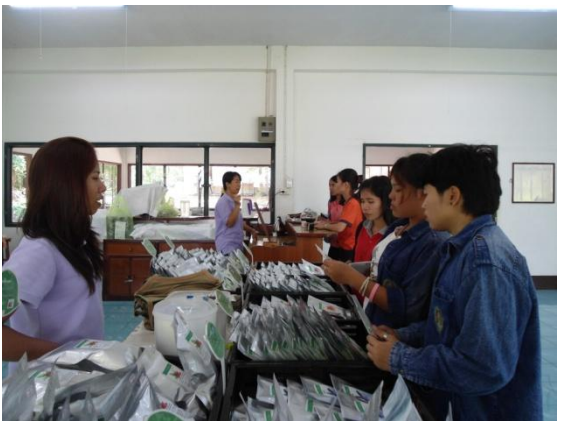
ชมสาธิตการควั่นชาใบหม่อน และชิมชาอินทรีย์ชนิดต่างๆ เช่น ชาใบหม่อน ชารางจืด เป็นต้น