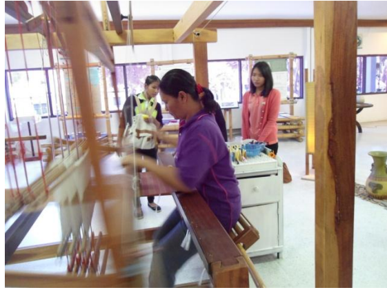
เยี่ยมชมนิทรรศการการย้อมเส้นไหมด้วยสีธรรมชาติ ชมสาธิตการทอผ้าด้วยกี่กระตุกแบบคันยก และเลือกชมผลิตภัณฑ์ผ้าไหมหลากหลายต่างๆ