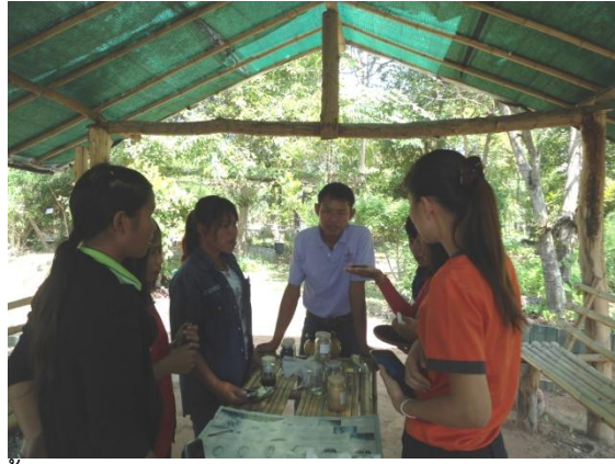
รู้จักและสัมผัสกับผักพื้นเมืองรสชาติต่างๆ