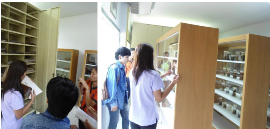
ศึกษาวิธีการเก็บและรักษาตัวอย่างพรรณไม้ ณ อาคารปฏิบัติการพฤกษศาสตร์