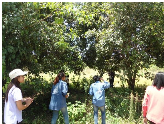
นั่งรถเพื่อชมบรรยากาศโดยรอบของศูนย์อนุรักษ์พันธุ์กรรมพืช อพ.สธ. คลองไผ่