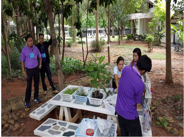
เยี่ยมชมวิธีการขยายพันธุ์พืชด้วยเทคนิคการเพาะเลี้ยงเนื้อเยื่อ และเลือกซื้อพืชที่ได้จากการเพาะเลี้ยงเนื้อเยื่อ