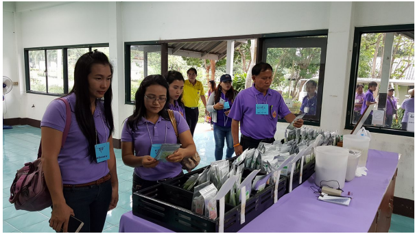
เยี่ยมชมการผลิตชาอินทรีย์ ชมสาธิตการคั่วชา ชิมชา และเลือกซื้อผลิตภัณฑ์ชาสมุนไพร