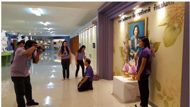
เยี่ยมชมอาคารพิพิธภัณฑ์ อพ.สร.