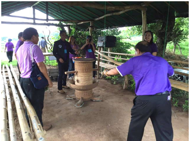
เยี่ยมชมแปลงปลูกรวบรวมพันธุ์ผักพื้นเมืองของไทย และทดลองใช้เครื่องกะเทาะเปลือกเมล็ดข้าวแบบโบราณ