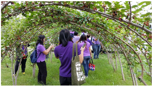
เยี่ยมชมแปลงปลูกหม่อนรับประทานผล และเรียนรู้วิธีการดูแลให้ผลติดผลตลอดปี