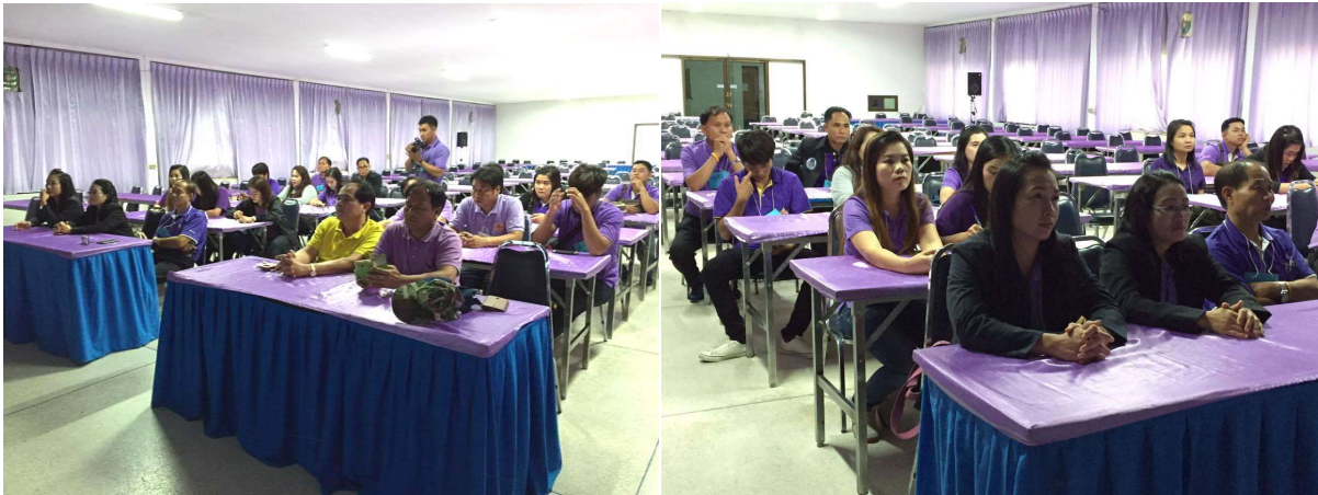
ฟังบรรยายความเป็นมาของศูนย์อนุรักษ์พันธุ์กรรมพืช อพ.สธ. คลองไผ่ ในห้องประชุม

เมื่อวันที่ ๒๓ กันยายน ๒๕๕๙ ทางศูนย์อนุรักษ์พันธุ์กรรมพืช อพ.สธ. คลองไผ่ ได้ให้การต้อนรับเจ้าหน้าที่องค์กรปกครองส่วนท้องถิ่น และบุคลากรของงานศึกษาและพัฒนาป่าไม้ ศูนย์ศึกษาการพัฒนาภูพานฯ จังหวัดสกลนคร จำนวน ๒๒ คน เข้าศึกษาดูงานภายในศูนย์อนุรักษ์พันธุ์กรรมพืช อพ.สธ. คลองไผ่ โดยมีเจ้าหน้าที่ อพ.สธ. คลองไผ่ ปฏิบัติงานวิทยากรต้อนรับและนำชม