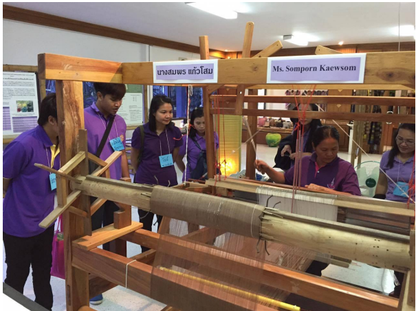
เยี่ยมชมนิทรรศการการย้อมผ้าไหมด้วยสีธรรมชาติ ชมสาธิตการทอผ้าด้วยกี่กระตุกระบบคันยก และเลือกซื้อผลิตภัณฑ์ผ้าไหมตราหยาดป่า