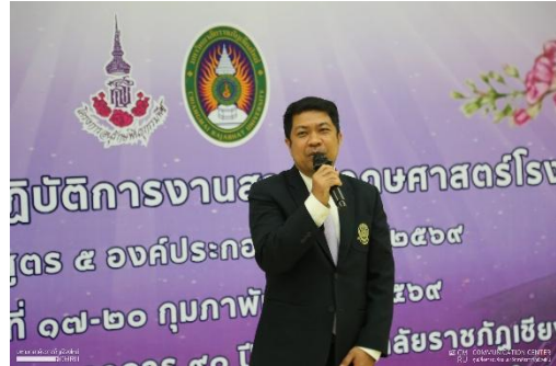
ภาพที่ 2 ภาพรวมผู้เข้าฝึกอบรมฯ และวิทยากรศูนย์ประสานงาน อพ.สธ.-มรภ.ชม.