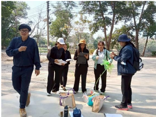
ภาพที่ 3 ฝึกปฏิบัติการ องค์กรประกอบที่ 1 - 4