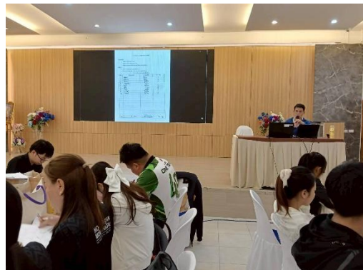
ภาพที่ 6 การนำเสนอผลงาน โดยผู้เข้ารับการฝึกอบรมฯ