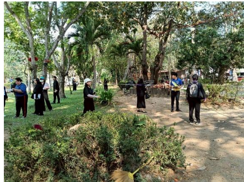
ภาพที่ 4 ฝึกปฏิบัติการ องค์กรประกอบที่ 1 - 4