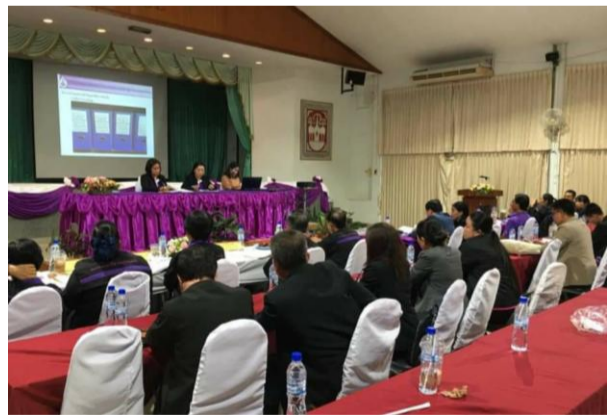
ภาพที่ ๖ ผู้เข้าร่วมประชุมฯ รับฟังการนำเสนอ การดำเนินงานฐานทรัพยากรท้องถิ่น