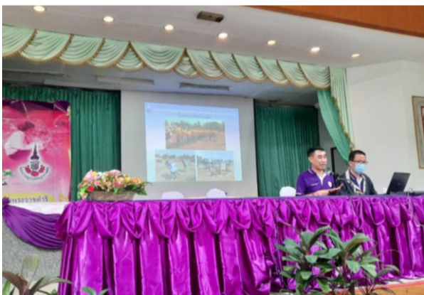
ภาพที่ ๓ นายกองค้การบริหารส่วนตำบลนาคู นำเสนอด้านที่ ๑ การบริหารและการจัดการ