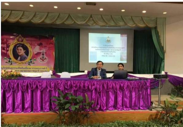
ภาพที่ ๕ ผู้อำนวยการโรงเรียนภูทอกวิทยา นำเสนองานที่ ๒ การสำรวจและจัดทำฐานทรัพยากรท้องถิ่น (๔ ใบงาน)