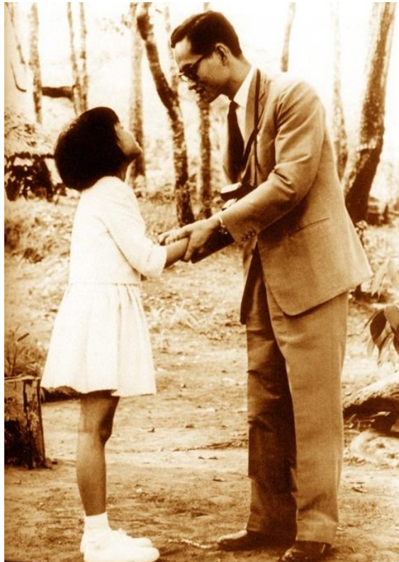
ภาพที่ 1.2 สมเด็จพระเทพรัตนราชสุดาฯ สยามบรมราชกุมารี ทรงสืบสานพระราชปณิธานของ พระบาทสมเด็จพระปรมินทรมหาภูมิพลอดุลยเดช