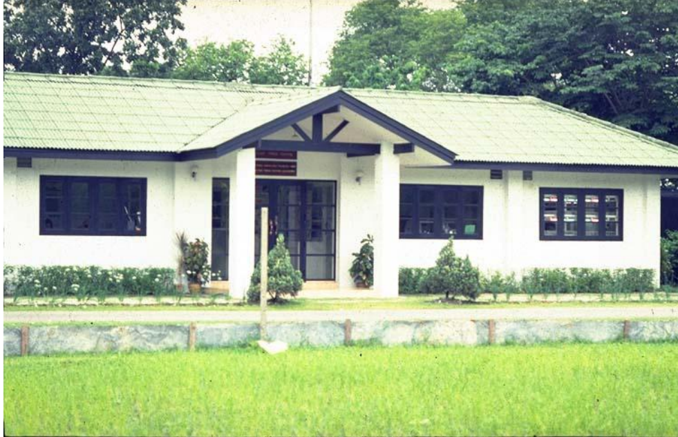
ภาพที่ 1.8 ธนาคารพืชพรรณ โครงการอนุรักษ์พันธุกรรมพืชอันเนื่องมาจากพระราชดำริฯ (อพ.สธ.)

เมื่อวันที่ 6 กรกฎาคม พ.ศ. 2531 ณ ศาลาดุสิตาลัย สวนจิตรลดา พระบาทสมเด็จพระปรมินทรมหาภูมิพลอดุลยเดช มีพระราชกระแสกับหม่อมเจ้าจักรพันธ์เพ็ญศิริ จักรพันธุ์ ให้ดำเนินการผสมพันธุ์ผักสองชั้น (double hybridization) พร้อมกันไปทั้งศูนย์ศึกษาการพัฒนาอันเนื่องมาจากพระราชดำริ และในห้วงปฏิบัติการเพาะเลี้ยงเนื้อเยื่อพืชของโครงการส่วนพระองค์ฯ สวนจิตรลดา