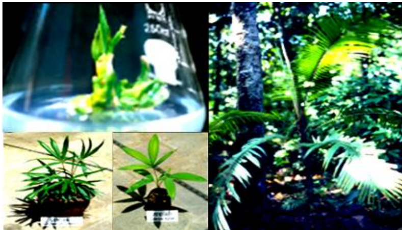
ภาพที่ 1.6 พืชตระกูลหวาย หนึ่งในพืชที่มีพระราชดำริให้อนุรักษ์และขยายพันธุ์

การดำเนินงานเกี่ยวกับหวายได้มีการขยายผลไปสู่ความร่วมมือระหว่างโครงการส่วนพระองค์ฯ สวนจิตรลดา สำนักพระราชวัง กับส่วนราชการจังหวัดตรัง จัดทำแปลงรวบรวมพันธุ์หวายขึ้นในพื้นที่ 1,000 ไร่ ที่ตำบลปะเหลียน อำเภอปะเหลียน จังหวัดตรัง เมื่อปี พ.ศ. 2532 และได้ນ้อมเกล้าฯ ถวายเป็นสวนหวายเฉลิมพระเกียรติ พระบาทสมเด็จพระปรมินทรมหาภูมิพลอดุลยเดช ซึ่งนอกจากจะเป็นสถานที่อนุรักษ์พันธุ์หวายชนิดต่าง ๆ ของประเทศไทยแล้ว ยังได้ใช้เป็นสถานศึกษา วิจัย และขยายพันธุ์หวายเศรษฐกิจ เพื่อให้ผลประโยชน์ถึงประชาชนอย่างกว้างขวางด้วย