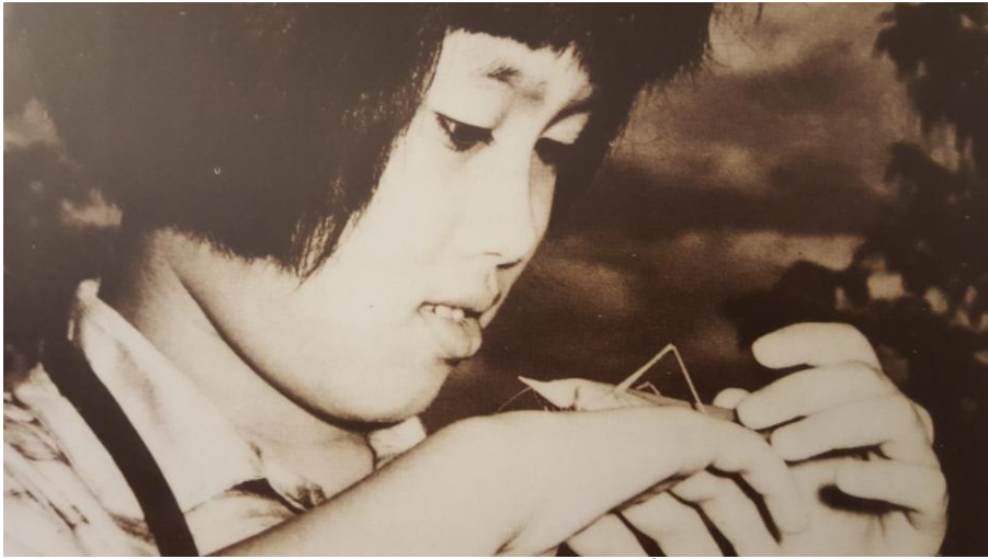
ภาพที่ 1.5 สมเด็จพระเทพรัตนราชสุดาฯ สยามบรมราชกุมารี เมื่อครั้งทรงพระเยาว์ ทรงสนพระทัยในธรรมชาติของสัตว์