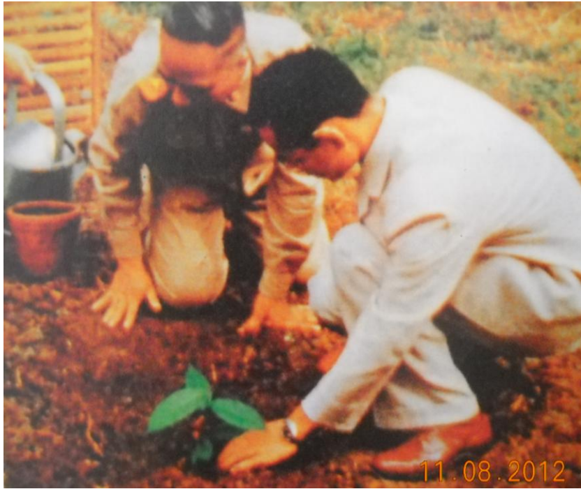
ภาพที่ 1.1 พระบาทสมเด็จพระปรมินทรมหาภูมิพลอดุลยเดช ทรงปลูกลูกยางนา ณ พระตำหนักเรือนต้น สวนจิตรลดา พระราชวังดุสิต กรุงเทพมหานคร เพื่อการอนุรักษ์พันธุ์กรรมพืช