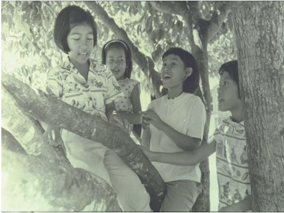
ภาพที่ 1.3 สมเด็จพระเทพรัตนราชสุดาฯ สยามบรมราชกุมารี ทรงประทับบนต้นไม้ เมื่อครั้งทรงพระเยาว์กับพระสหาย