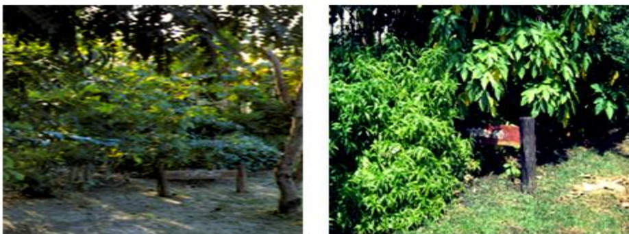
ภาพที่ 1.7 พรรณไม้ในสวนสมุนไพร สวนจิตรลดา

ในปี พ.ศ. 2529 นอกจากมีพระราชดำริให้มีการอนุรักษ์พันธุ์กรรมหวายแล้ว ยังได้ให้จัดทำสวนพืชสมุนไพรขึ้นในโครงการส่วนพระองค์ฯ สวนจิตรลดา เพื่อรวบรวมพืชสมุนไพรมาปลูกเป็น แปลงสาธิต และรวบรวมข้อมูล สรรพคุณ ตลอดจนการนำไปใช้ประโยชน์ กับทั้งให้มีการศึกษาขยายพันธุ์สมุนไพร โดยการเพาะเลี้ยงเนื้อเยื่อและเผยแพร่ความรู้ที่ได้สู่ประชาชน